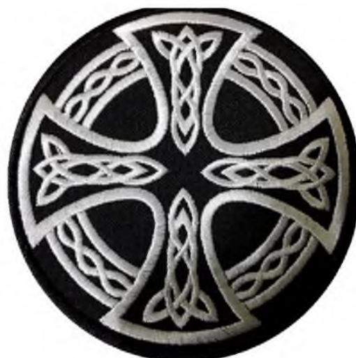
Рисунок 2. Кельтский крест. Символ многих расистских организаций